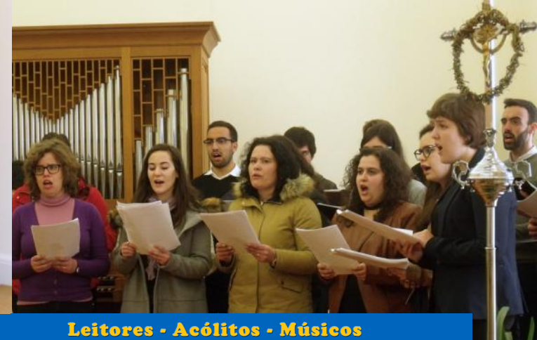
Leitores - Acólitos - Músicos